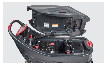
Réservoir de récupération avec poignée permettant de le faire basculer facilement