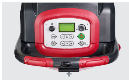
Panneau de commande intuitif avec écran LCD sur tous les modèles (AS6690T/AS7690T en photo)